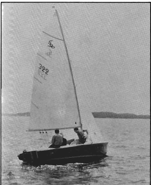
Vers la ligne de départ