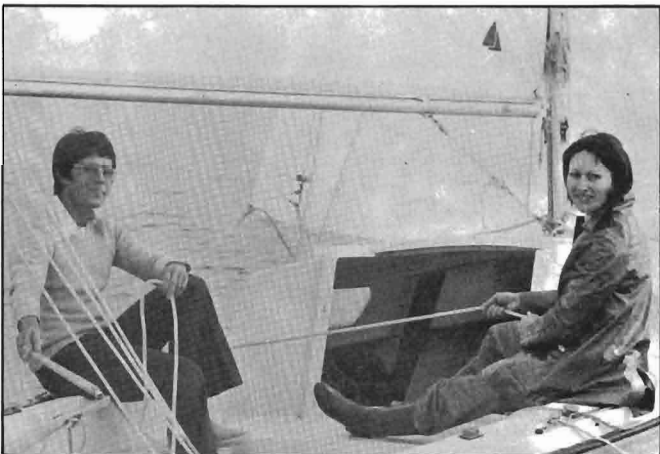
Serge MAURY, Champion Olympique, se détend sur 590, entre deux victoires en Finn.

Le 590 , déjà produit à plus de mille exemplaires en FRANCE et à l'Etranger est désormais construit par la société BRUNET-France à le TAILLAN-MEDOC Gironde.